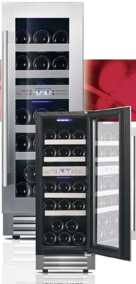
LBN 178 NOIRE poignées noire et inox incluses

Plinthe couleur noire en option ref : 92040841